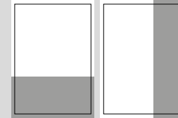
1/3 SEITE QUER ODER HOCH