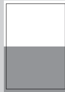
1/2 SEITE QUER