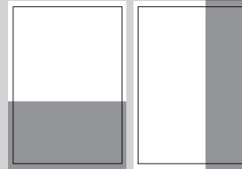
1/3 SEITE QUER ODER HOCH