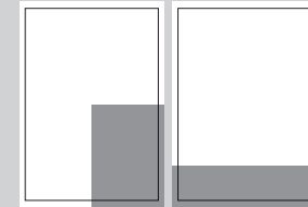
1/4 SEITE ECKFELD ODER QUER